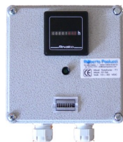
Strumentazione di Misura